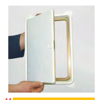
Tipska Schiedel vratanca.

Razmak od drvenih delova konstrukcije mora biti najmanje 5 cm!